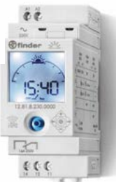
Typ 12.81.8.230.0000 1 Wechsler - 16 A 110...230 V AC/DC