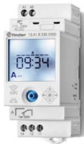
Typ 12.A1.8.230.0000 1 Wechsler - 16 A 110...230 V AC/DC