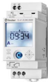
Typ 12.61.8.230.0000 1 Wechsler - 16 A 110...230 V AC/DC

Kommunale Beleuchtung (Straßen, Plätze, Denkmäler, Brunnen...) Gärten, Parkplätze, Geschäfte, Leuchtschilder, Bewässerungssysteme, Heiz- und Kühlanlagen.