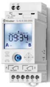
Typ 12.A2.8.230.0000 2 Wechsler - 16 A 110...230 V AC/DC