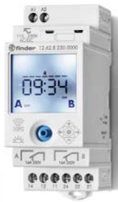
Typ 12.62.8.230.0000 2 Wechsler - 16 A 110...230 V AC/DC