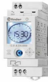
Typ 12.51.8.230.0000 1 Wechsler - 16 A 110...230 V AC/DC

Bewässerungssysteme, Heiz- und Kühlanlagen, Geschäfte, Leuchtschilder und Zugangssteuerungen für Türen.