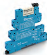
Obr. 5 MasterPLUS typ 39.31