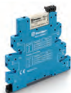
Obr. 2 MasterBASIC typ 39.11