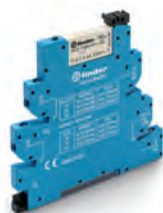
Obr. 2 MasterBASIC typ 39.11