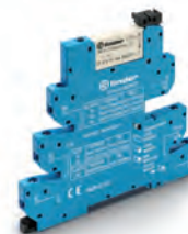
Obr. 5 MasterINPUT typ 39.41