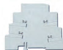
Obr. 6 Izolační deska 093.60 (šířka 1,8 mm nebo 6,2 mm)